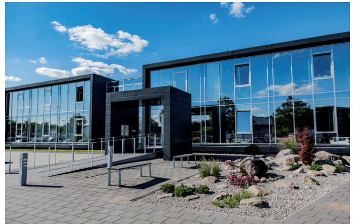
Firmenzentrale in Flensburg